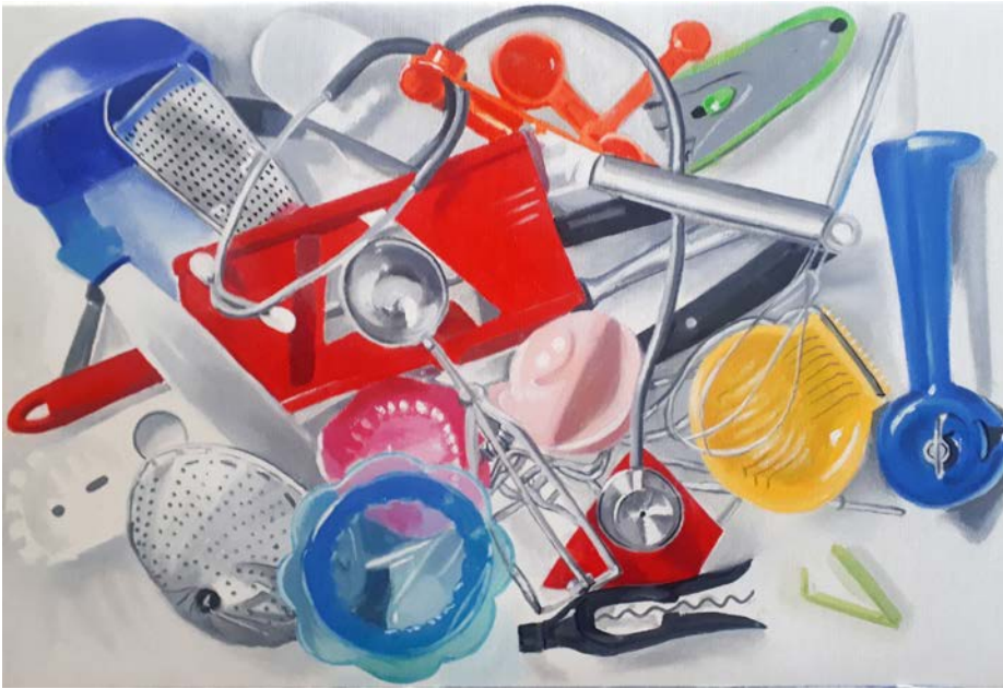
Interiors 3, Catherine Gobat, huile sur toile, 2022.